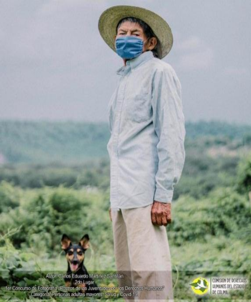
Autor: Carlos Eduardo Martínez Sanhilañ 2do Lugar 1er Concurso de Fotografía "Rostros de las Juventudes por los Derechos Humanos" Categoría: Personas adultas mayores; Salud y Covid-19