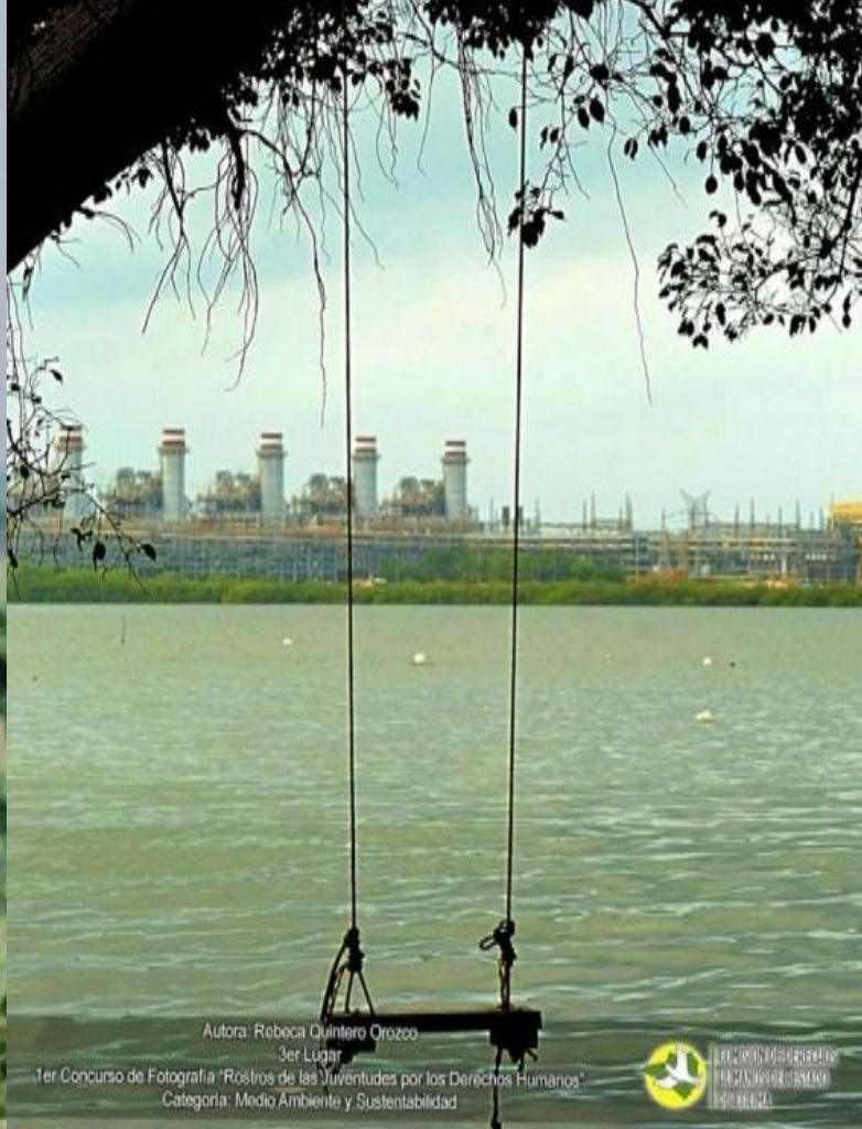
Autora: Rebeca Quintero Orozco 3er Lugar 1er Concurso de Fotografía "Rostros de las Juventudes por los Derechos Humanos" Categoría: Medio Ambiente y Sustentabilidad

COMISIÓN DE DERECHOS HUMANOS DEL ESTADO DE COLIMA